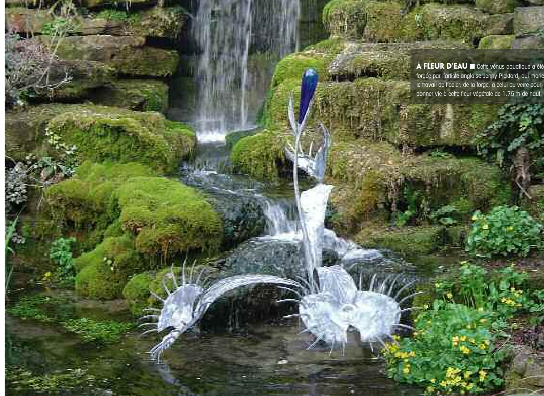
À FLEUR D'EAU ■ Cette vénus aquatique a été forgée par l'artiste anglaise Jenny Pickford, qui marie le travail de l'acier, de la forge, à celui du verre pour donner vie à cette fleur végétale de 1,75 m de haut.